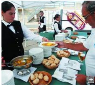
1. Todos los premiados en las distintas categorías de clase crucero tras el acto de entrega de galardones en Puerto América 2. También en Puerto América se celebró una comida para regatistas e invitados. 3. Imagen de veleros participantes en la regata tomada desde la playa de Camposoto en San Fernando 4. La regata de ciudades constitucionales dejó otras bonitas postales como esta de las embarcaciones frente al castillo de Sancti-Petri en Chiclana.

El recorrido de la regata, previsto para cubrir por mar el espacio entre Cádiz y San Fernando en jornada de ida, el sábado, y vuelta, el domingo, ha transcurrido por lugares de la Bahía de especial belleza que además propiciaron bonitas estampas para los observadores desde tierra. Así, se partía de Puerto América hacia las inmediaciones de la Punta de San Felipe. Después los barcos navegaron por la Bahía hacia mar abierto llegando frente al castillo de San Sebastián para pasar después frente a las playas Victoria, Cortadura y Camposoto y transcurrir por la línea de la costa hasta el castillo de Sancti-Petri, navegar por el caño del mismo nombre y finalizar en el puerto de Gallineras, en San Fernando. Eso a la ida, el sábado. El domingo, el recorrido se hizo justo a la inversa.