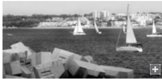
La regata partió ayer por la mañana desde Puerto América rumbo a San Fernando.

Con buenos vientos y una participación de 57 barcos se desarrolló ayer la primera jornada de la a su vez I Regata de Ciudades Constitucionales organizada para la clase crucero dentro de los actos conmemoración del segundo centenario de La Pepa.