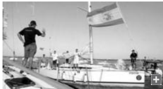
Una de las embarcaciones participantes en la regata, atracando en el puerto isleño de Gallineras.

Por la mañana se respiraba una actividad frenética en Puerto América. Multitud de ciudadanos se acercaron para poder ver de cerca el acontecimiento. Por su parte los participantes se reunían en torno a la carpa habilitada para las inscripciones, llegando a un total de 57 barcos, superando con creces todas las expectativas.