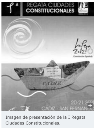
Imagen de presentación de la I Regata Ciudades Constitucionales.